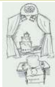
Wereld van verschijnselen